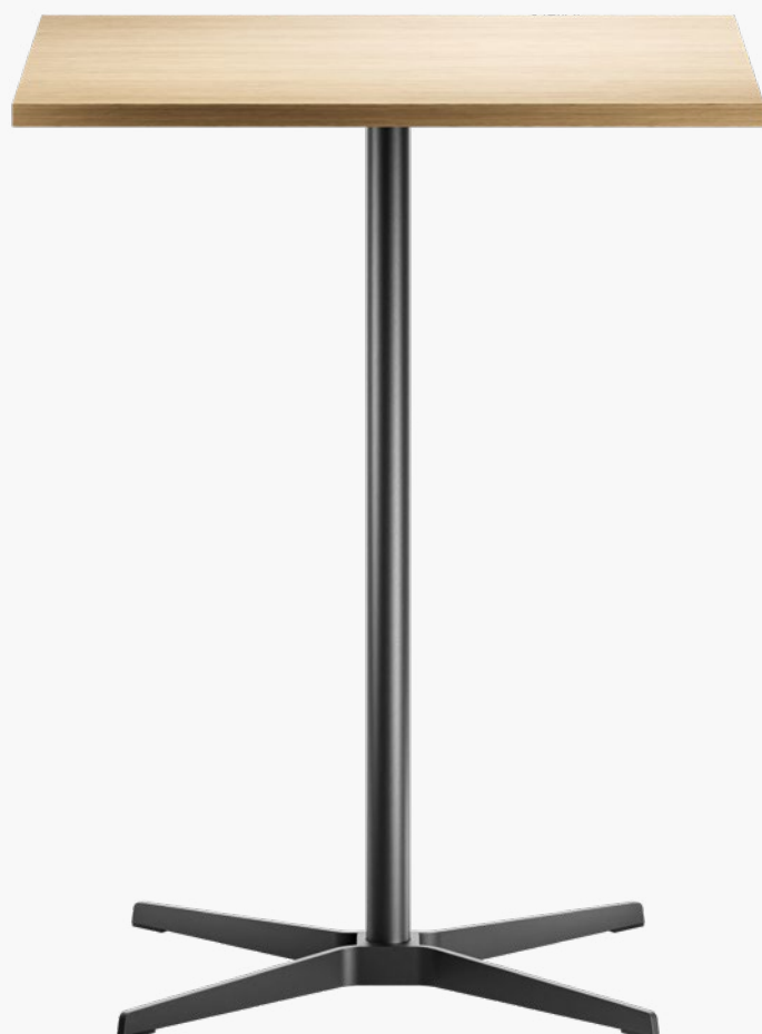
TABLE 1818 DE/EN 02.23

Translation: proidioma Sprachdienstleistungen