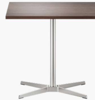
1818 GESTELL FLACHSTAHL, TISCHPLATTE ECHTHOLZFURNIER ODER SCHICHTSTOFF/FRAME FLAT STEEL, TABLETOP REAL WOOD VENEER OR LAMINATE