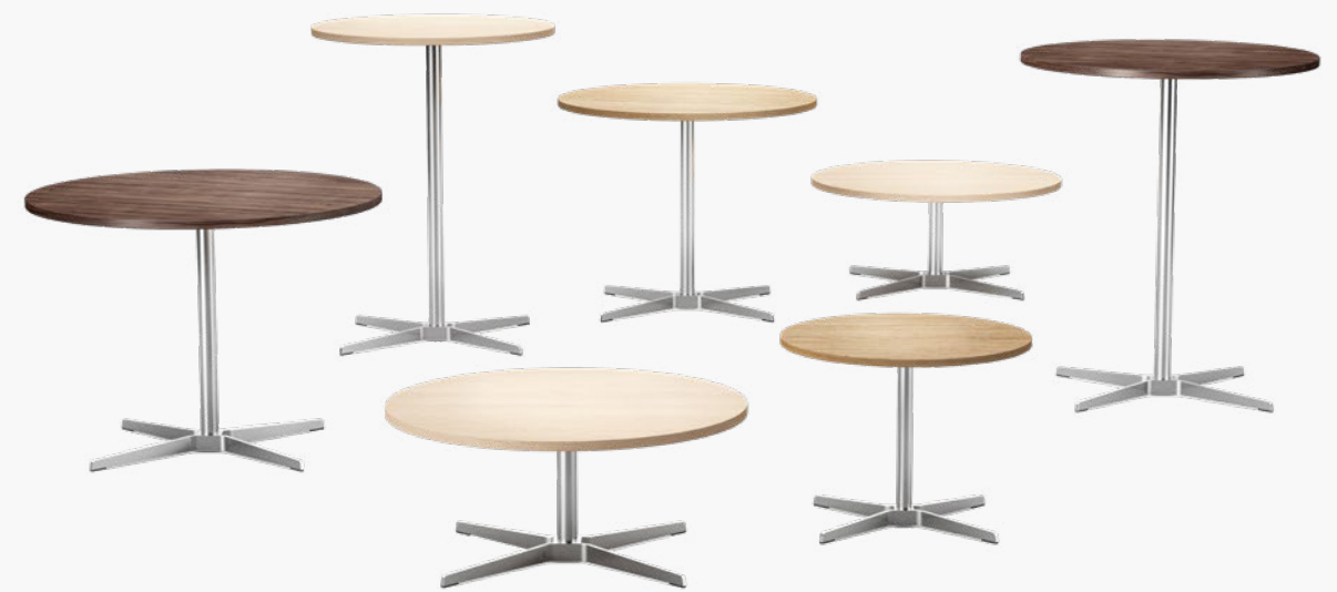
1818 & 1828 OBERFLÄCHE IN NUSSBAUM, BUCHE UND EICHE/ SURFACE IN WALNUT, BEECH AND OAK

EN Designers Claudia Kleine and Jörg Kürschner of Formstelle have designed minimalist bistro tables in two sizes that match the armchairs and side tables of the lounge range 808. The product family 808 is growing and has been extended by the table 1818 with a height of 74 cm and its big brother 1828 as a high table with a height of 105 cm. The elegant bistro tables create space for communication and are perfectly suited for use in the restaurant and reception segments.