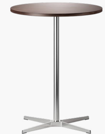
1828 GESTELL FLACHSTAHL, TISCHPLATTE ECHTHOLZFURNIER ODER SCHICHTSTOFF/FRAME FLAT STEEL, TABLETOP REAL WOOD VENEER OR LAMINATE