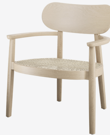
119 F ROHRGEFLECHT/ WICKERWORK