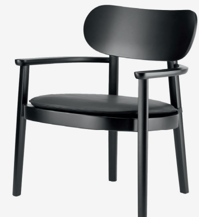
119 MF UND 119 PA MULDENSITZ MIT SITZKISSEN/ MOULDED PLYWOOD SEAT WITH SEAT CUSHION