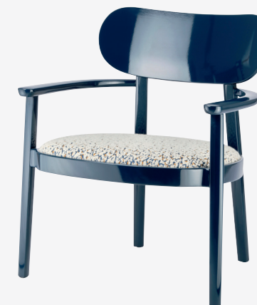
119 SPF SITZ GEPOLSTERT/ UPHOLSTERED SEAT