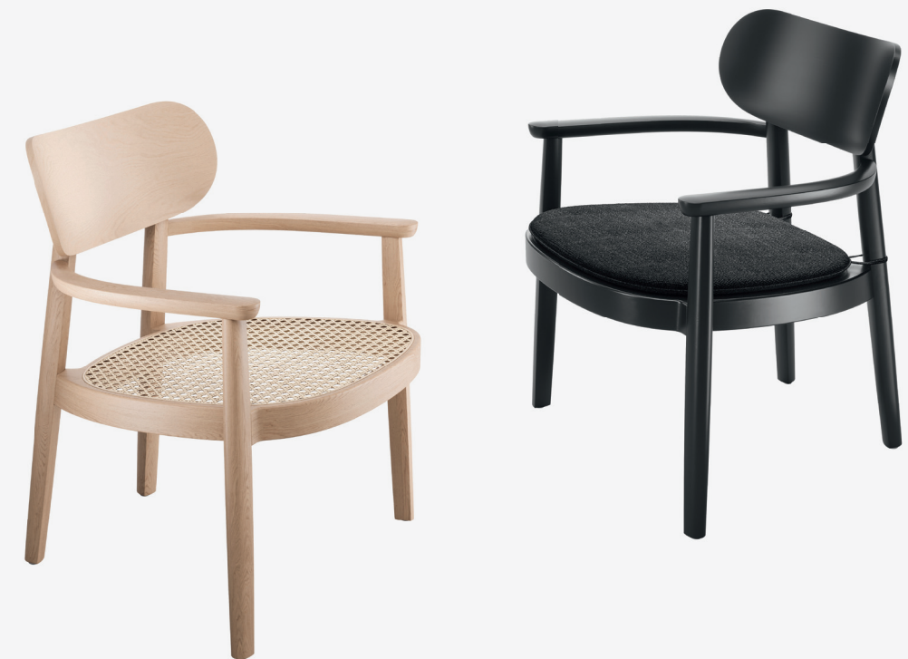
119 F & 119 MF MIT/WITH 119 PA SITZ MIT ROHRGEFLECHT, MULDENSITZ MIT POLSTERAUFLAGE PA/ SEAT WITH WICKERWORK, MOULDED SEAT WITH SEAT CUSHION

The relationship with the 118 chair family is evident in both the design principle and several finer details: the shape of the chair legs, for example, which are rounded at the back and have gentle edges at the front, echoes the characteristic horseshoe shape of the seat base. A bentwood frame encloses the seat of the 119, in the same ways as all models in the 118 collection, and each is available in a canework or a moulded plywood seat. Sebastian Herkner has also designed a loose seat cushion for the lounge chair, which is available on request. The chair comes in the same stain colours and high-gloss lacquers as all the models in the 118 collection.