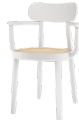
118 F ROHRGEFLECHT/ CANEWORK