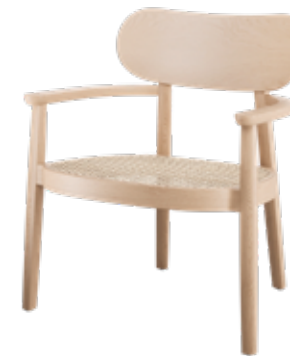
119 F ROHRGEFLECHT/ CANEWORK