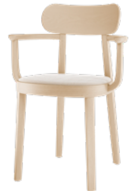
118 SPF SITZ GEPOLSTERT/ SEAT UPHOLSTERED