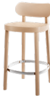
S 118 HT ROHRGEFLECHT/ CANEWORK