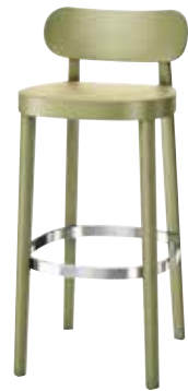
118 H ROHRGEFLECHT/ CANEWORK