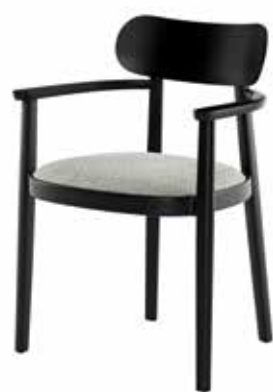
118 SPFV SITZ GEPOLSTERT/ SEAT UPHOLSTERED