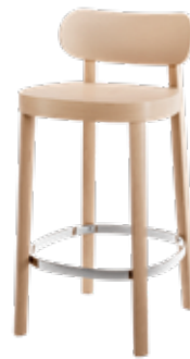
118 MHT MULDENSITZ/ MOULDED PLYWOOD SEAT