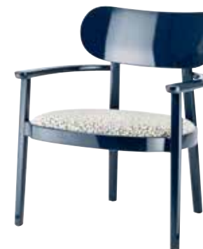
119 SPF SITZ GEPOLSTERT/ UPHOLSTERED SEAT