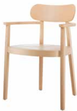
118 MFV MULDENSITZ/ MOULDED PLYWOOD SEAT