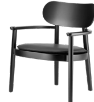
119 MF UND 119 PA MULDENSITZ MIT SITZKISSEN/ MOULDED PLYWOOD SEAT WITH SEAT CUSHION