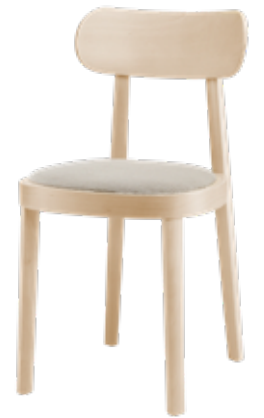
118 SP SITZ GEPOLSTERT/ SEAT UPHOLSTERED