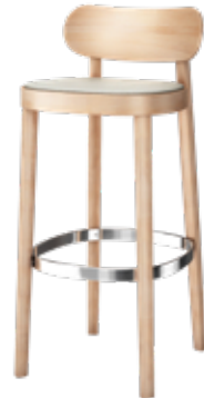
118 SPH SITZ GEPOLSTERT/ SEAT UPHOLSTERED