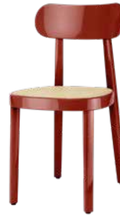
118 ROHRGEFLECHT/ CANEWORK