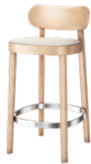
118 SPHT SITZ GEPOLSTERT/ SEAT UPHOLSTERED