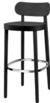
118 MH MULDENSITZ/ MOULDED PLYWOOD SEAT