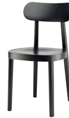
118 M MULDENSITZ/ MOULDED PLYWOOD SEAT