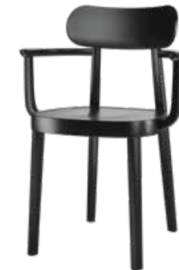
118 MF MULDENSITZ/ MOULDED PLYWOOD SEAT