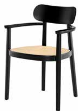
118 FV ROHRGEFLECHT/ CANEWORK